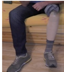
L'expérience du corps prothésé