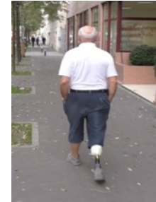
L'expérience des situations de handicap